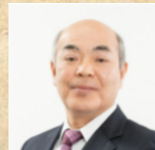
(株)ディアレストパートナー 代表取締役