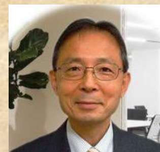
キャリアデザイン研究所 所長