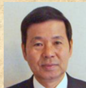
(株)システムプランニング 代表取締役